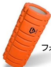
フォーム ローラー

専用のローラーを背中や太ももでコロコロ 転がし、硬くなった筋肉をほぐします。 激しい動き、無理な姿勢がなく、誰にでも 簡単にできます！